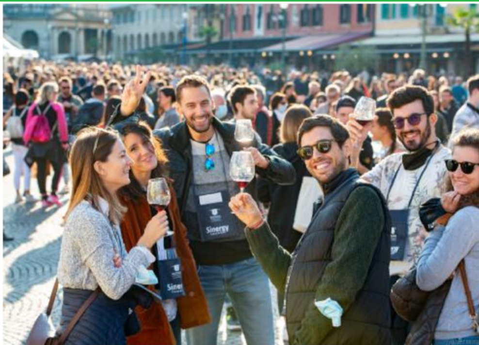
Piazza Bra affollata Pienone ieri in centro città in occasione di «Hostaria»