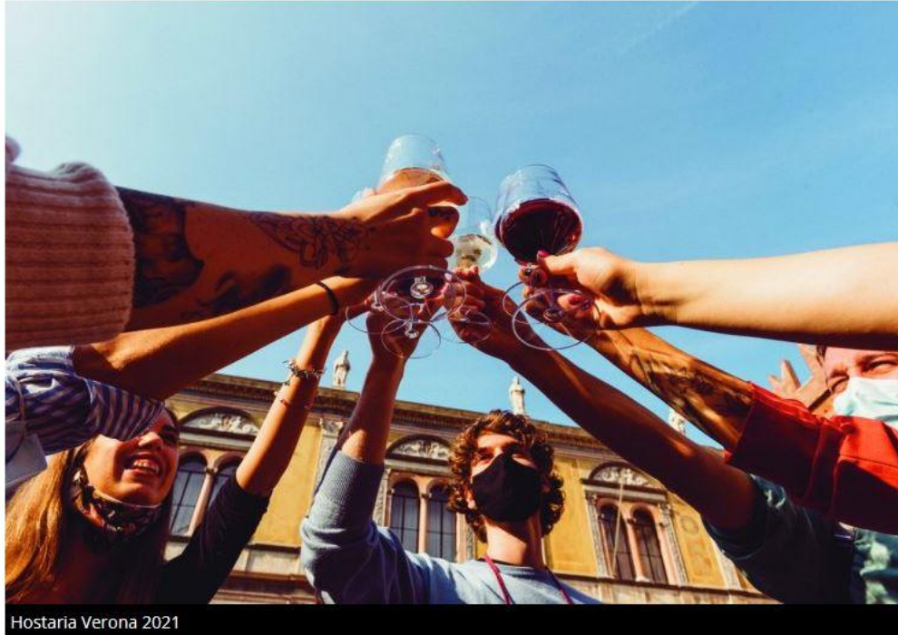
Hostaria Verona 2021