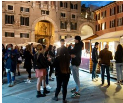
In tutto il centro Piazza dei Signori è solo uno degli spazi della rassegna