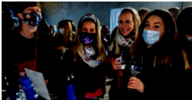
Hostaria un momento dell'edizione 2020 Luca Mazzara pag.19

LA MANIFESTAZIONE Domani il via della tre giorni. «Un orgoglio per il nostro territorio»