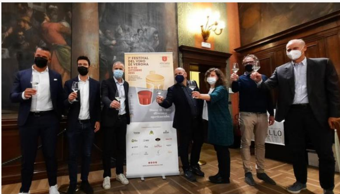
La presentazione di Hostaria

«Hostaria» all'edizione numero sette: torna dall' 8 al 10 ottobre il festival del vino e dei sapori, quest'anno dedicato alla memoria di Nicoletta Ferrari, fondatrice di DisMappa. Durello in piazza dei Signori, Custoza e Garda doc in Cortile Mercato Vecchio, Lugana in piazza Bra, per tre giorni 350 etichette nel centro storico scaligero.