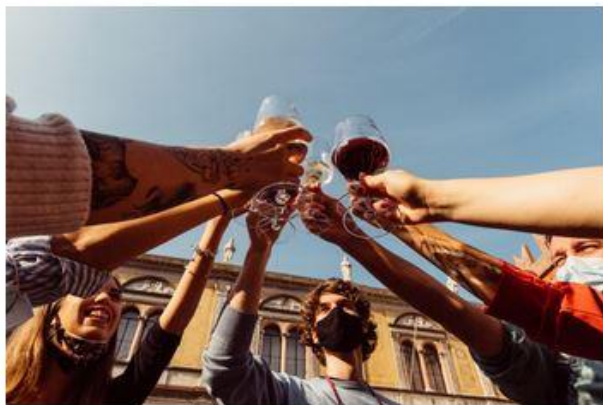
Hostaria: al via l'edizione 2021

influencer che coinvolgeranno visitatori e follower in degustazioni esclusive. Saranno invece oltre 100 i giornalisti e blogger accreditati. Non poteva poi mancare la presenza ormai consolidata del Consorzio di Tutela Monte Veronese: come da tradizione, il Consorzio allestirà il Villaggio del Monte Veronese , dove sarà possibile partecipare alle degustazioni guidate e ai laboratori didattici per adulti e bambini.