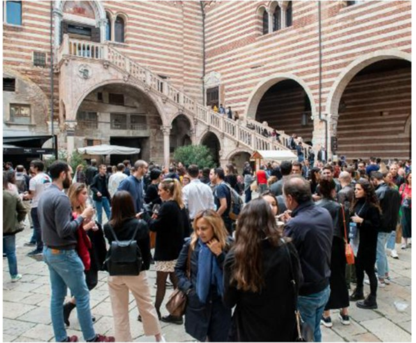
Il cortile mercato vecchio affollato per Hostaria nel pomeriggio di ieri FOTOSERVIZIO MARCHIORI