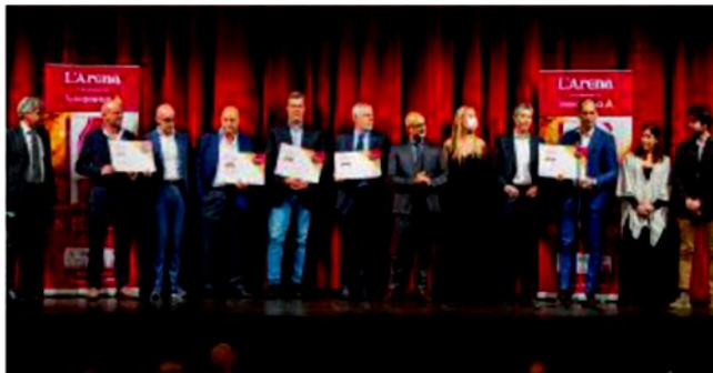
La festa di Top 100: la consegna dei premi speciali

LA FESTA È stata presentata al Teatro Nuovo la guida edita da Athesis. Sarà distribuita in tutte le edicole