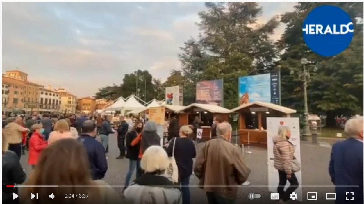
Torna Hostaria a Verona

https://www.youtube.com/watch?v=R1Mg9jMc1U