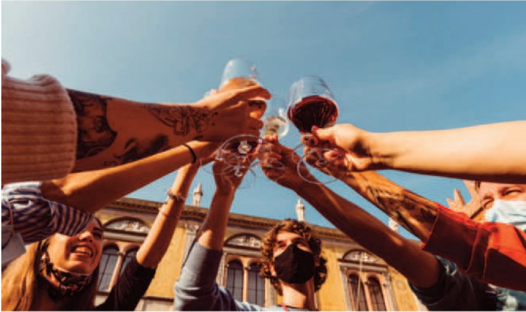
Alcune foto della precedente edizione