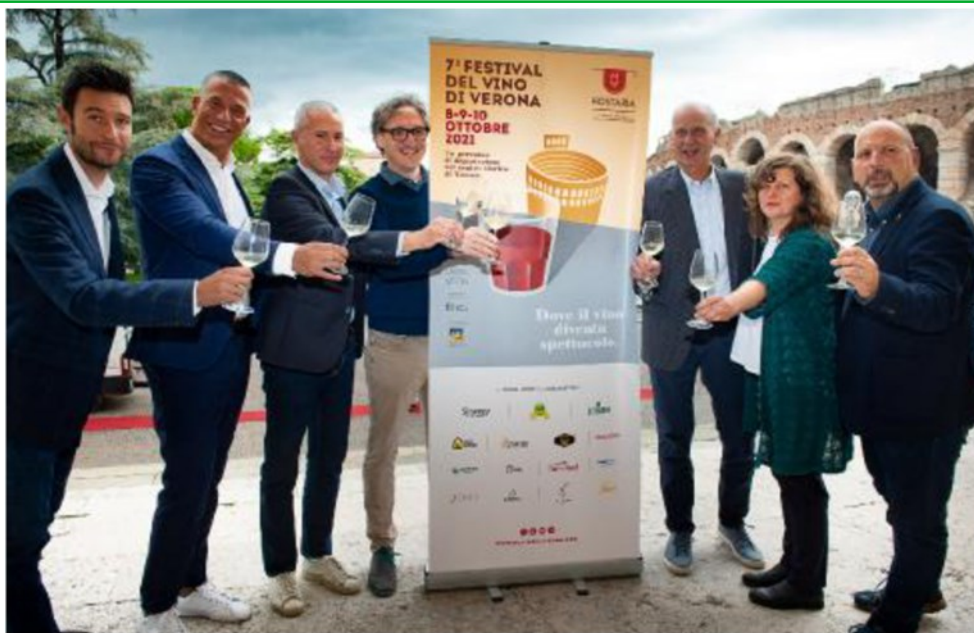
Tutto pronto La presentazione di Hostaria in programma da domani a domenica

Senza dimenticare i partner Durello & Friends, il Consorzio tutela Vino Custoza, il Garda Doc, la novità Casa Lugana e ancora Atv con i biglietti a un euro associati al ticket della manifestazione, oltre ad Acque Veronesi ed Amia. E continua anche la partnership con il gruppo editoriale Athesis. «Poco prima dell'inaugurazione noi presenteremo la guida dei vini Top 100, e siamo orgogliosi di essere ancora di fianco agli organizzatori di Hostaria», conferma il direttore di Publiadige Marcello Galletti, «in un festival di eccellenza per il nostro territorio». ●