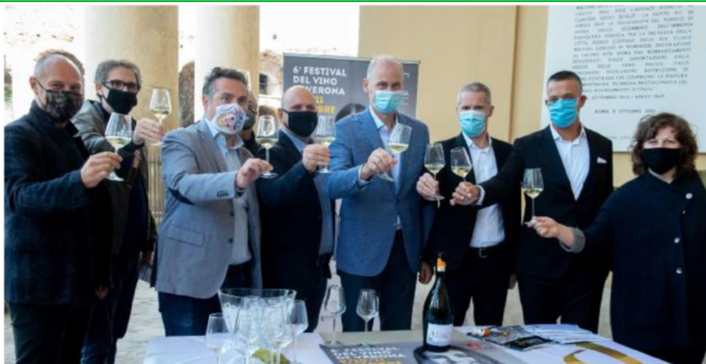
Manifestazione I protagonisti di Hostaria in occasione della presentazione dell'edizione di Hostaria del 2020