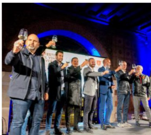
Taglio del nastro Il brindisi all'inaugurazione della rassegna