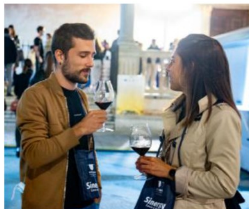
Alta qualità Centinaia le etichette proposte nei vari stand