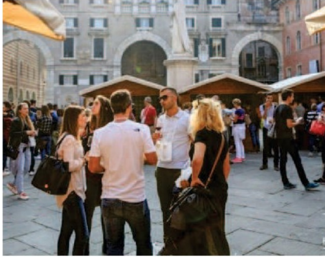
Un momento di una delle precedenti edizioni