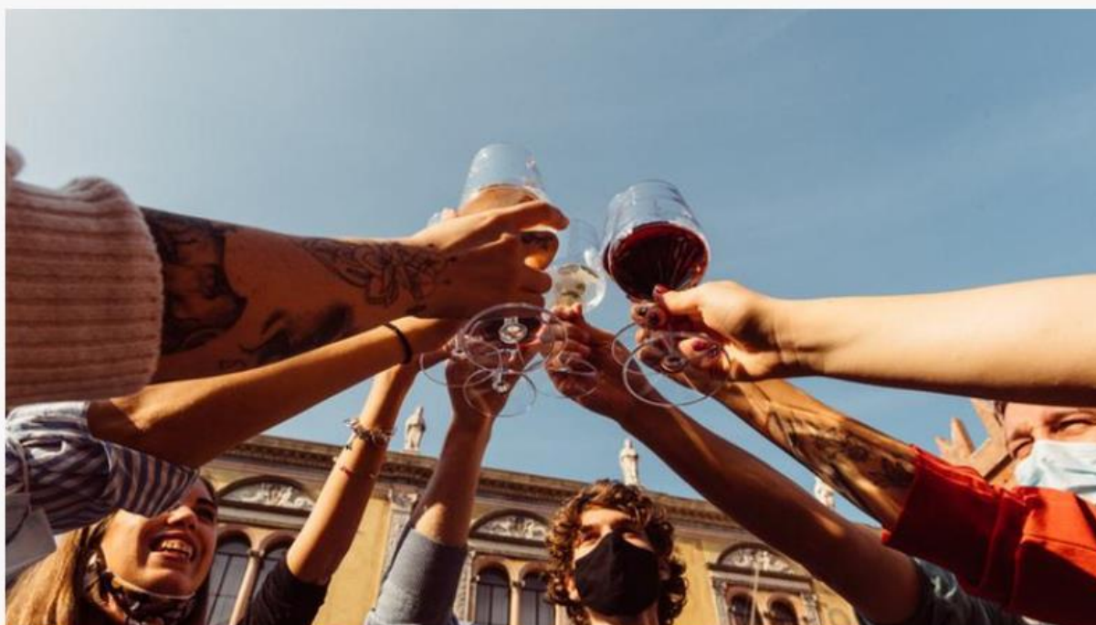
Hostaria Verona, dall'8 al 10 ottobre, la settima edizione del festival

Prende il via domani, venerdì 8 ottobre, alle 18, la settima edizione di "Hostaria" Verona, il festival del vino e dei sapori , in programma fino al 10 ottobre 2021 tra le vie e le piazze del centro storico di Verona, con oltre 350 referenze vinicole ospiti.