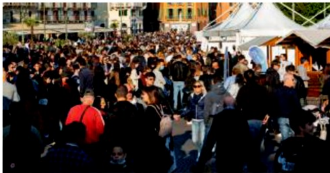
Piazza Bra affollata in occasione di «Hostaria» 2021

IL BILANCIO Un successo la tre giorni di degustazioni e incontri, molti visitatori si sono fermati a soggiornare in città