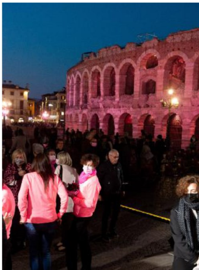
Tumore al seno L'Arena in rosa per ricordare il valore della prevenzione