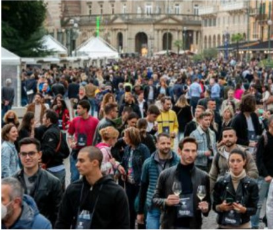
Piazza Bra affollata dove inizia il percorso dedicato al vino